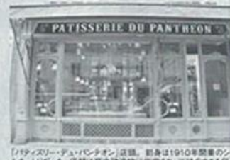
料理のようにお菓子を作る

しいセンスと実力を備えた若いパティシエが登場して、パティスリーは再び人々の関心を集めるようになった。特にパリではエルメ(エルメ・デュ・パティスリー)のような高級ブランドのパティスリーが話題を呼び、それを追いかけるように高級パティスリーを標榜する店が次々と開店している。その多くは知名度を高めるために広報イベントを介してマスコミに積極的に働きかけ しかし、そうした喧騒をよそに質の高いお菓子を真摯に作り続け、確実にお菓子愛好家を惹きつけている店もある。パリ左岸、カルティエエラタンにあるパティスリー・デュ・パンテオンはその一つ。 伝統的なパリの菓子店の雰囲気を保つ金色の文字を壁面に刻んだ味を醸成したが、美しいアントルメが並ぶショーウィンドウの前で思わず立ち止まり写真を撮るフリストも多い。 主力製品は、パティスリーだけでなく焼き菓子、ゼンファンズリー、コンフィチュール、ショコワ、そしてキッシュやパナなどの総菜類。さらに6、7種のパンが揃っている。これらはすべて店の地下にある別荘で作られる。