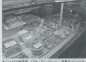
キンシュウの総菜類。【パン・アン・クルート】(写真左)はシルムキムアイエだったデザルダン氏の父親のレシピで作る

は売れ行きを見て近更なら再び製造する。手間はかかるがそれによって常に新鮮な製品を出すことができる。同じ目的で、ヴェイヴズリーやパンも一日中焼成している。 高級でトロワクロワンのシェフパティシエに この店のもう一つの魅力はお菓子の質の高さに比べて価格が大変安いことだ。新鮮で質が良く、かつ価格が高すぎないこと、店には近所の住人に加えてパリの至る所から人が来る。「じぶんを宣伝活動よりも口コミ