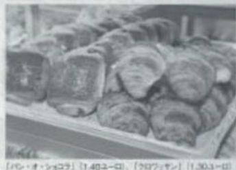
【パル・オ・ショコワ】(1,400円) 【クロワッサン】(1,300円)